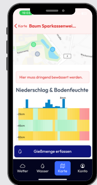
APP inkl. KI