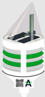
ONE IoT Funkbox